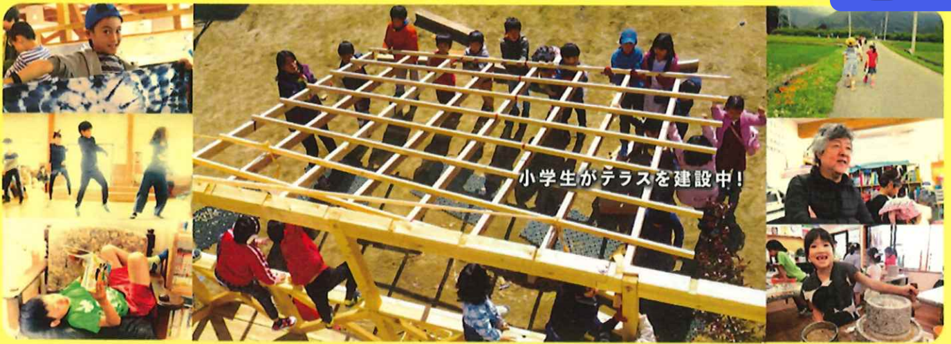
小学生がテラスを建設中!